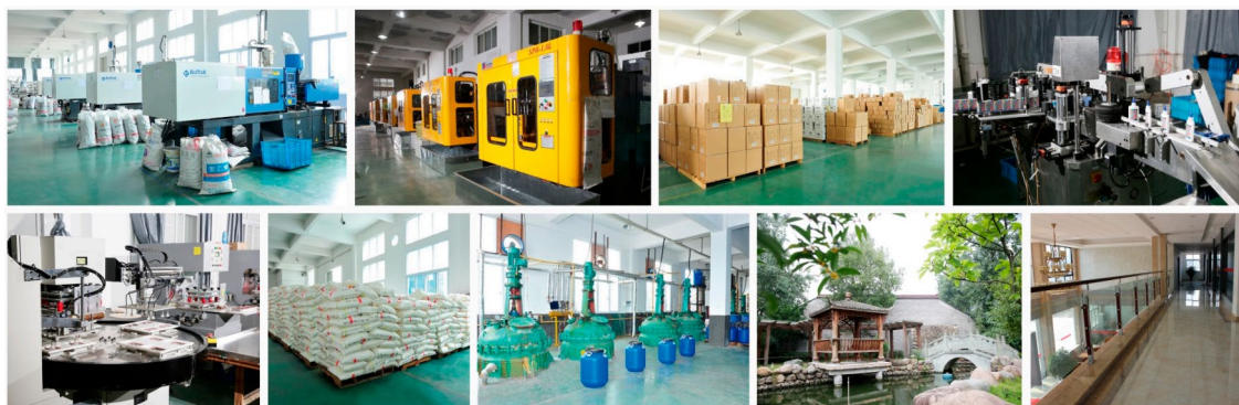
公司主要工艺技术和装备

公司结合自身实际，建立了完善的质量管理体系，贯彻以原料稳定、工艺稳定、操作稳定最终确保质量稳定的方针。公司拥有 20 亩的胶水生产基地，拥有加工设备 70 余台套，具备年产 5000 万支固体胶、2400 万支液体胶产能。品质方面，公司通过 ISO9001 管理体系认证，具备完善的检测能力，包括电热恒温鼓风干燥箱、数显恒温水浴锅、温度湿度计等，保障产品质量。